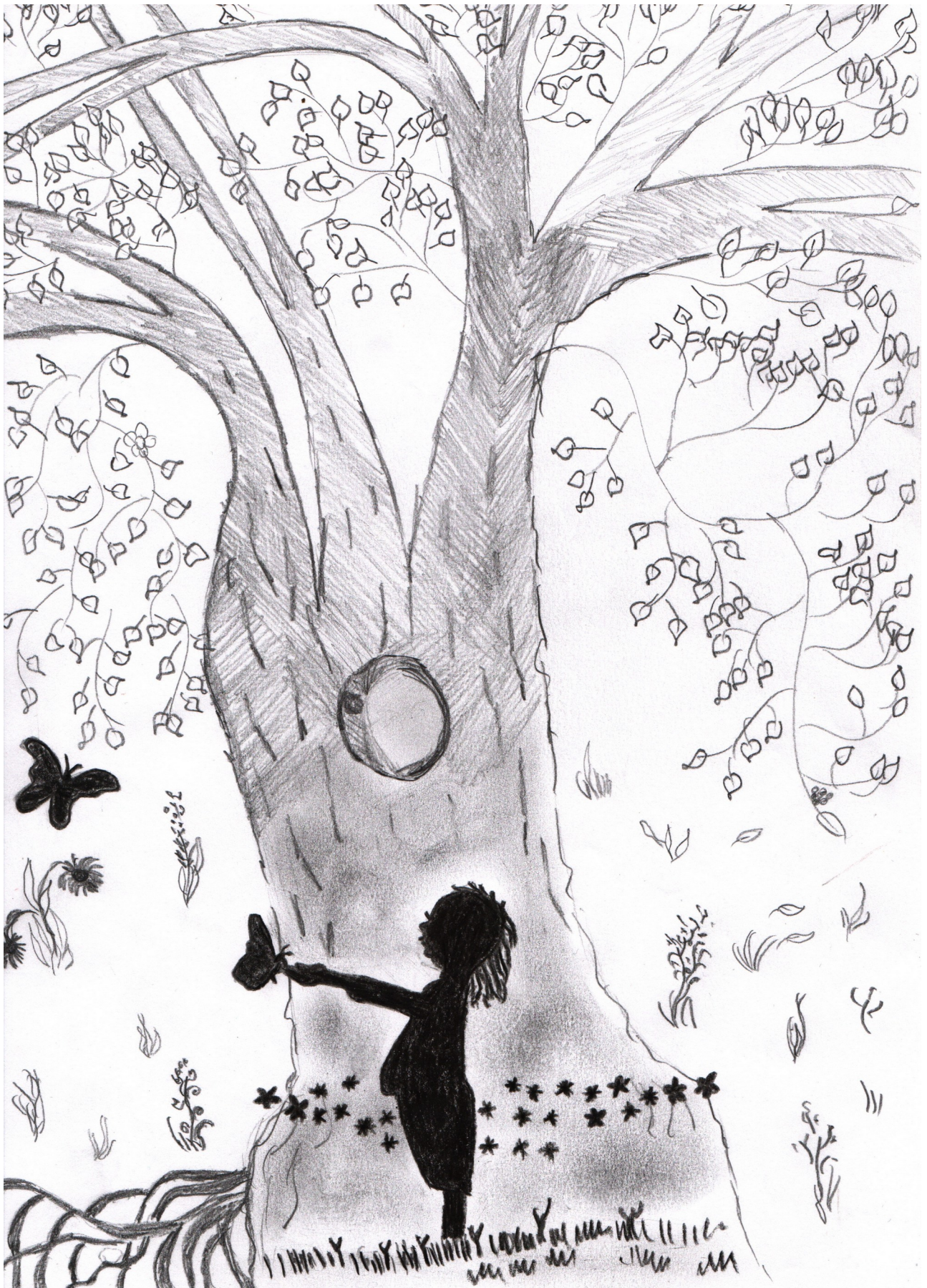
Álom a nyárról