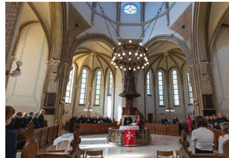
A lovagi istentisztelet résztvevői