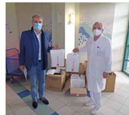
Átadás Tatabányai Kórházban

Az akció a Kiskuhalason felállított Konténer Járványkórház dolgozóinak ebéd kiegészítésével kezdődött Nagycsütörtökön és tartott egészen Pünkösdig. Csomagolt sütemény, friss gyümölcs és gyümölcslé került a Johannita kínáló asztalra.