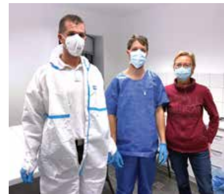
Tesztelő csapat Szokolán

Minden adományt személyesen adtunk át és mellékelünk hozzá egy köszönőlevelet, amelyben a johanniták 900 éves ispotályos, gyógyító feladatára utalva köszöntük meg a járvány leküzdésében részt vállalók munkáját.