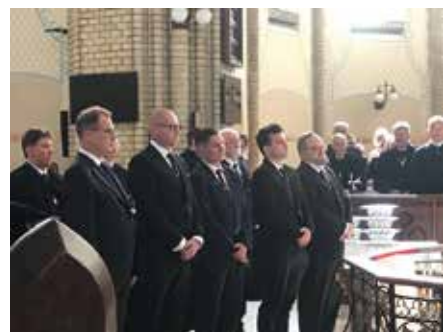
Öt új lovagtárs avatása

A gregorián zene Európát már születése pillanatában zenei egységgel ajándékozta meg, törzsanyagát az egész kontinensen ismerték, azonban a későbbi gyarapodás során nem minden dallam lett közkinccsé. Először a IX-X. században jegyezték le, szoros értelemben ezt a törzsanyagot nevezzük gregorián éneknek, mely a legelső keresztény századok óta folyamatosan épült fel. Dallamvezetése a régi stílusú gregorián dallamok többsége kis hangterjedelmű és zenei alaprége recitatív. A recitáció lényege az, hogy elsődlegesen a szöveg szabályozza a zenei formát és dallamot. Egy-egy dallamegység – motívum – egy vagy két főhangra épül rá, azokat rajzolja körül kis ambitusú motívumokkal. A recitáció minden ősi zenében alapvető fontosságú (így például a népszokásokban is). A liturgiában azért válik alapréggé, mert a szent szövegnek, a kinyilatkoztatott szónak hirdetése, hordozása van rábízva. A zenének követnie kell a szöveg tagolódását: a mondat vége egy zenei periódus vége, a mondat belső megállásainak megfelelően a zene belső tagoló pontjai. A recitáció esetén egy