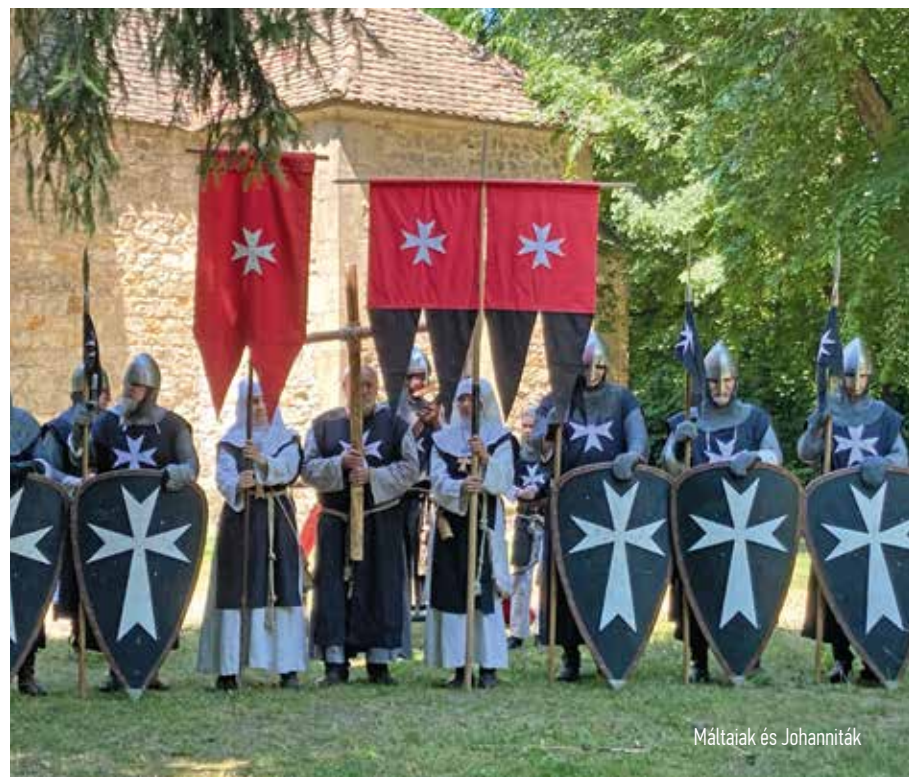
Máltaiak és Johanniták