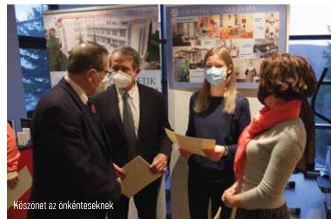
Köszönet az önkénteseknek

Önkénteseink a Pólus Centerben, polgármesteri hivatalokban, iskolákban, idős- és egészségügyi otthonok orvosi szobáiban stb. teszteltek.