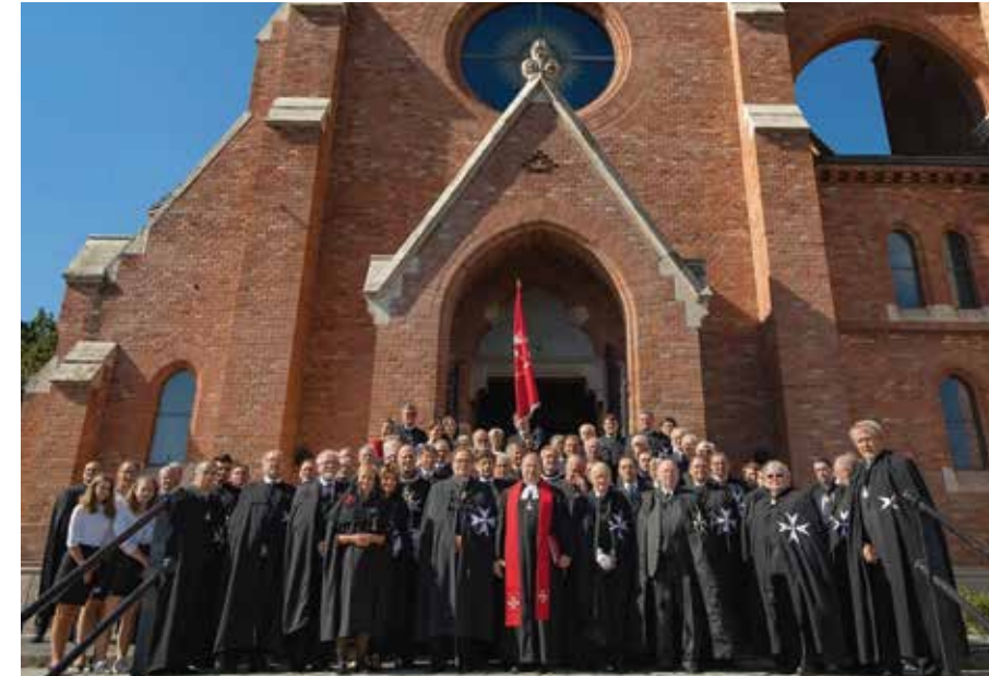
Lovagok csoportképe a Szilágyi Dezső téri templom főbejárata előtt