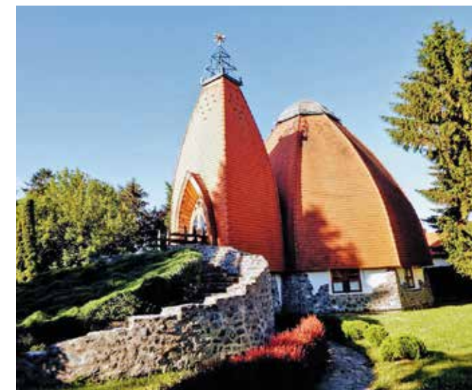
A református templom

Az Istentisztelet során káplánunk a régi idők liturgiáját ötvözte a jelenlévő fiatalokra való tekintettel mai egyházi énekekkel, így ők is közelebb érezhették magukhoz az áhitatot, és éneklésükkel bekapcsolódhattak abba.