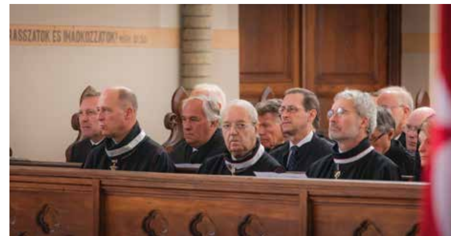
A máltai vendég rendtársak a lovagi istentiszteleten