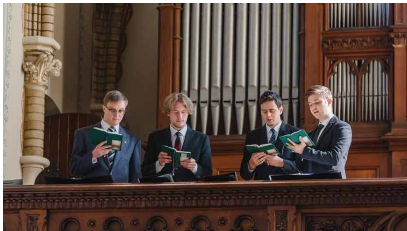
Gregorián liturgikus énekekkel szolgáló evangélikus férfiak

A gregorián ének (cantus gregorius), a római egyház ősi egyszólamú, latin nyelvű, liturgikus éneke, mellyel az Evangélikus Hittudományi Egyetem négy ifjú hallgatója szolgált az istentiszteleten.