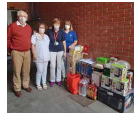
A Szent-Imre kórházban

kórház biztosította. Több helyen is sort keríthetünk a tesztelésre Szokolától Balatonfüredig és a két fő ponton: a Mechwart ligetben és a Pólus Centerben.