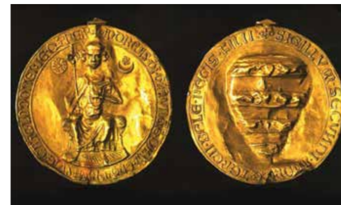
II. András Aranybullája

Csütörtöki délután nagy része az orosz – ukrán háború kapcsán nyújtott segítségekről szólt, és nagy érdeklődéssel fordultak a magyarok jelentése felé, mint akik a legközelebb vannak a tűzvonalhoz. Ebben kiemeltük a megtapasztalt johannita egységet, ahogy a háború kitörésekor azonnal és egységesen megmozdultak, és hogy azóta is támogatnak bennünket munkánkban.