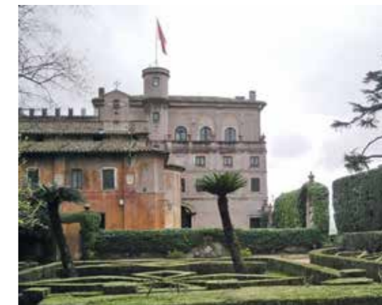
Máltai palota, Róma