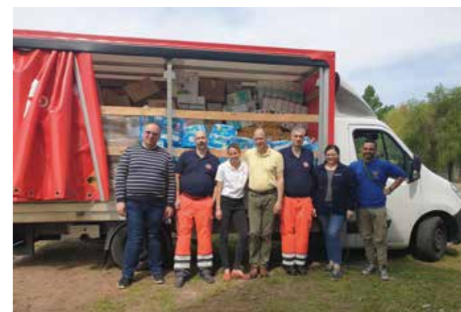
Megtelt a máltai-johannita kisteherautó