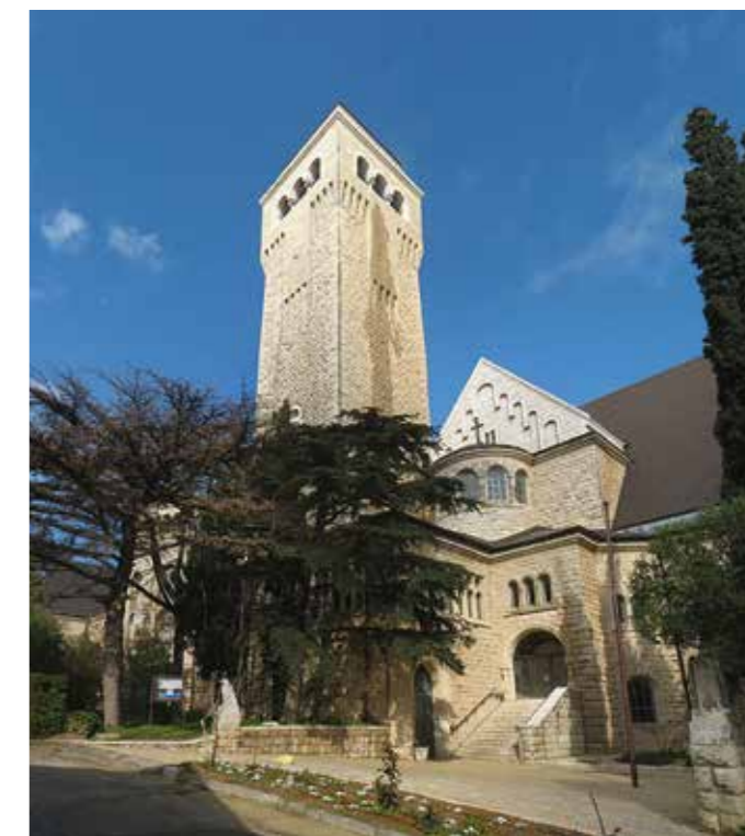
Menzibementel temploma, Jeruzsálem

Az arabok, és így a muszlim arabok magukat Ábrahám fia, Izmael leszármazottjának tartják. Az Ószövetségben a szövetség öröksége Izsáknak és le-származottjainak adatik, amely Isten kegyelméből később választott néppé szerveződhetett. Izsák és Izmael, Ábrahám két fiának magjából származó sémi népek együttélése mindmáig súlyos konfliktusokkal terhelt. A zsidók és az arabok, keresztények és magukat Izmael kései leszármazottjainak tekintők között is évezredekre visszanyúló harcok zajlottak.