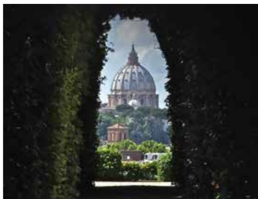
Kilátás a Szt. Péter bazilikára