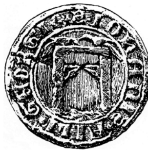
Az ősi címer