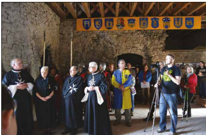
Ünnepi megemlékezés a kápolnában