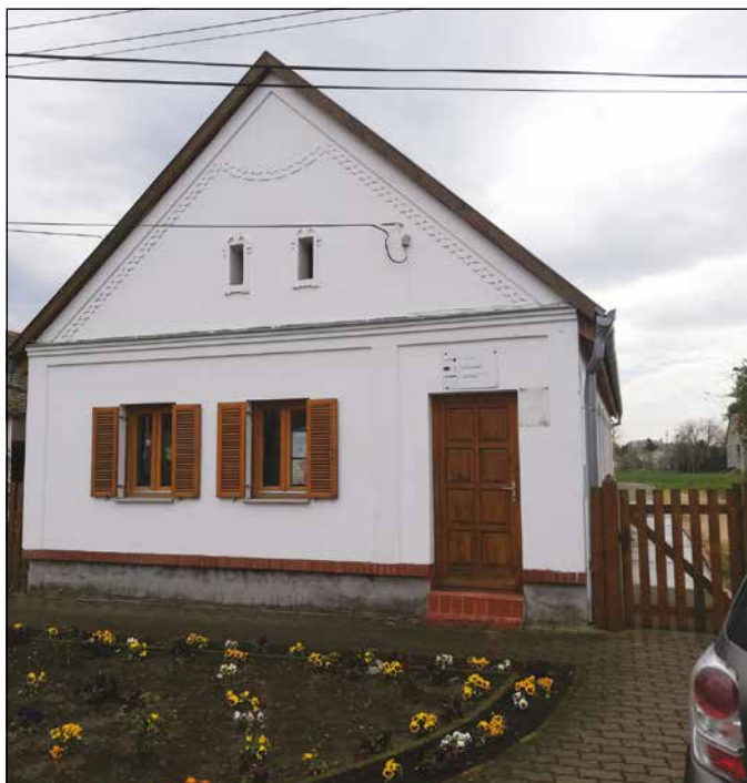
Jó kis hely Kémes

Ekkor jön egy fiatal református lelkész házaspár, akit megragad Ezékiel könyvének 37.-ik szakasza, hisz az Úr szavának: Istenünk a száraz csontokat is meg tudja eleveníteni, ha van aki az ígét hirdeti. Beáll a magvető munkájába és teszi, amit tenni kell és lehet: kiscsoportos bibliáórákat -, gyermek és felnőtt konfirmációs oktatást tart, énekkart szervez.