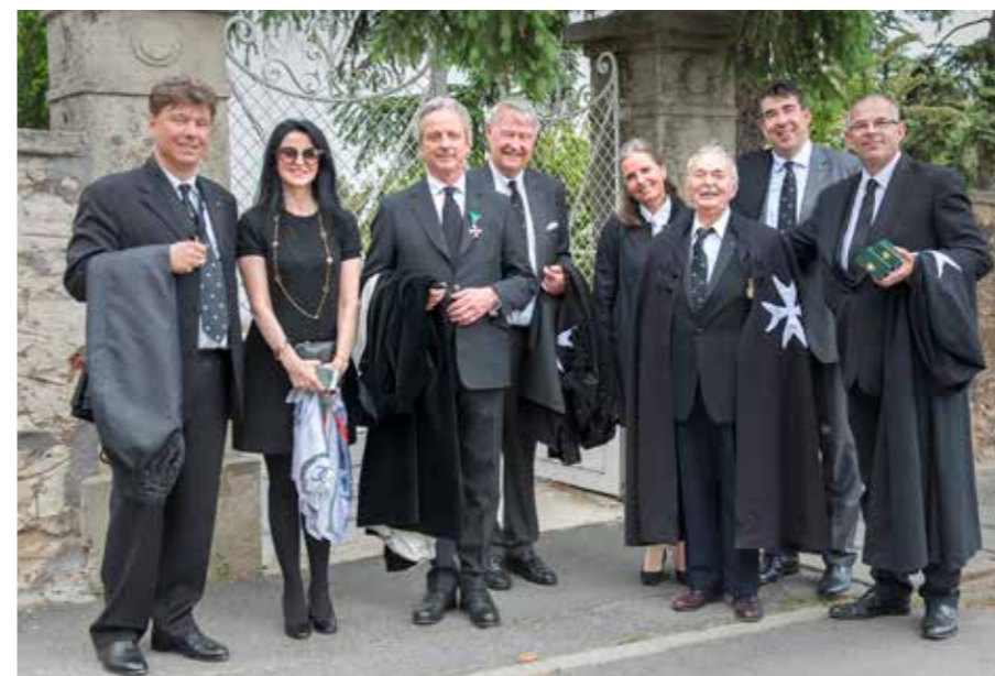
A lovagi istentisztelet után

Október elején megrendeztük első lovagi konferenciánkat Balatonszárszón. A rendi káptalan hosszas viták és egyeztetések után elfogadott egy olyan helyzetfelmérő és jövőbe tekintő anyagot („Der Johanniterorden heute: Standortbestimmung und Perspektiven”) amely fontos témakörök köré építette a rend álláspontját, és amely a magyar lovagok számára is érdekes és követendő tudnivalókat tartalmaz. Ezeket és más közérdekű témákat tárgyaltunk meg mi lovagok magunk között egy-egy testvérünk felkészülésével és utána széleskörű szabad vélemény nyilvánítással. A péntek délutántól vasárnap délig tartott rendezvény legfőbb értéke ugyanakkor a közösségformálás volt: közelebb kerültünk egymáshoz, jobban megismertük, megértettük, elfogadtuk egymást. Büszké lehetünk arra, hogy az első ízben megszervezett