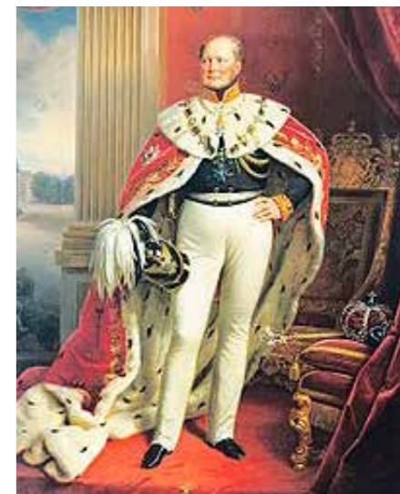
IV.Frigyes Vilmos király

40 évvel később, 1852-ben IV. Frigyes Vilmos király volt az, aki újjá élesztette a Johannita