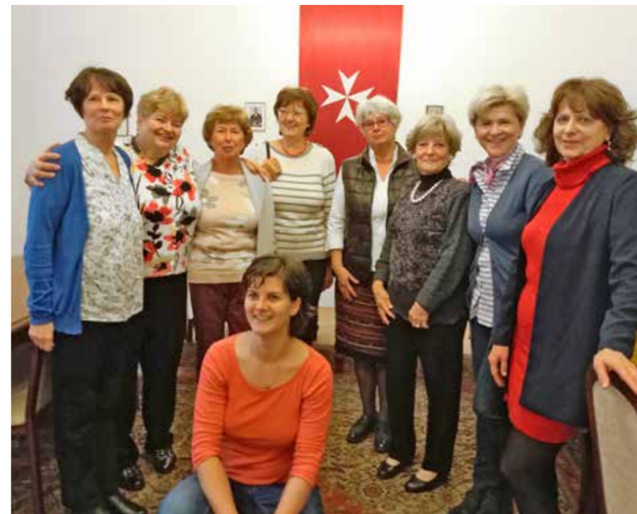
Adventi csomagolás után a Hölgyecsoprot tagjai

December 15-én Tiszafüreden jártunk. A Szivárvány Otthon adventi ünnepségén vettünk részt, a Johannita Hölgyecsoprot küldeményét vittük és adtuk