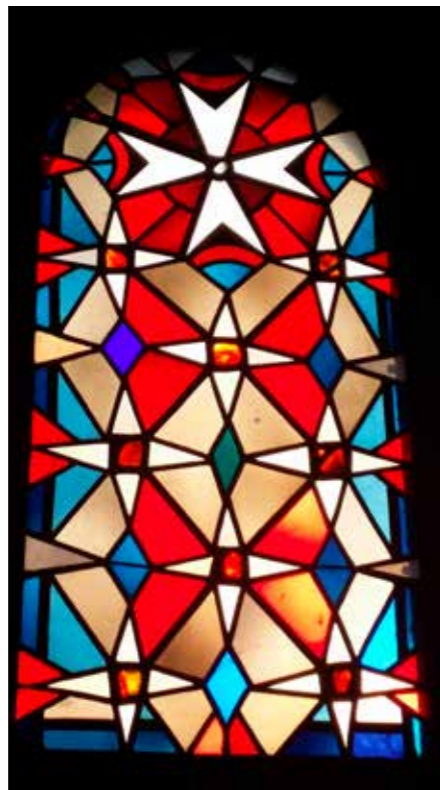
A kép a Komturkirche (Nieder-Weisel) ablaka

2019-ben az év igéjében e békeségre szólítás rejlik: ...törekedj a békeségre, és kövesd azt! (Zsolt 34, 15b). A 34. zsoltárban Dávid király dicsőíti Isten nevét, mert az Úr szorult helyzetében megsegítette őt. Az előttünk álló évre tekintve fogadjuk meg, hogy minden napunk Isten dicsőítésével kezdődjön, ahogy a nagy király tette a zsoltár bevezetőjében: Áldom az Urat mindenkor, állandóan őt dicsérsi szám. (34, 2) Semmi nem gátol minket magánéletünkben, gyülekezetünkben és lovagi közösségünkben, hogy a teremtő és megváltó Szentháromság Istent dicsőítő kozmikus kórusba kapcsolódjunk be. Nagy titok ez, de e titok megragadó, sőt elbűvölő erő, ami átforgalmazza gondolkodásunkat. Dávid király dicsőíti Isten szent nevét, és miközben ezt teszi megragadottá lesz, bizonyágtevővé, tisztává és mindannyiunk tanítójává nemesül, vagyis megszentelődik. Csak a Szentlélek ereje ad nekünk is élő hitet és hit által