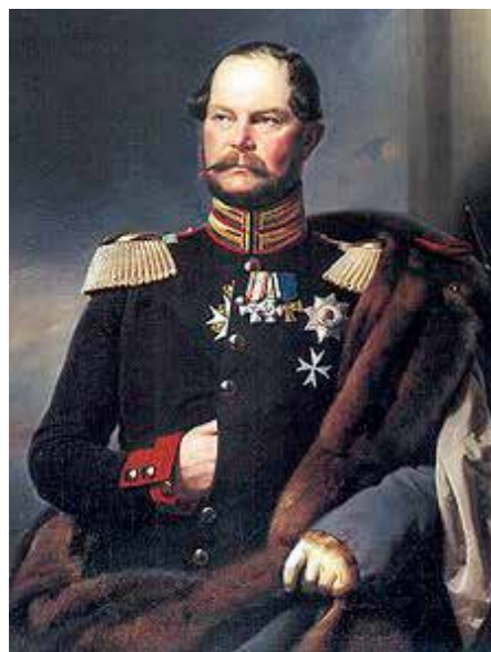
Carl von Preußen

Rend Brandenburgi Rendtartományát. Testvérét, Károlyt javasolta úrmesternek. akit egy évvel később, 1853-ban, az intézményi folytonosságban megmaradt nyolc – még 1812 előtt a rendbe felvett – jogi lovag ünnepélyesen úrmesterré választott és ezt le is jelentették a Nagymesteri Hivatalnak. Ez a hivatal időközben Rómában találta meg a helyét a rend korábbi, Vatikánhoz rendelt követségén, ahol ma is van. Az új úrmesterek beiktatásának elismerését a Nagymesteri Hivatal Rómában abbéli reményében fejezte ki, hogy a rend katolikus ágának is sikerül megújulnia Né-